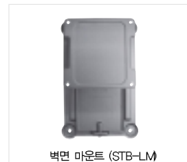
벽면 마운트 (STB-LM)